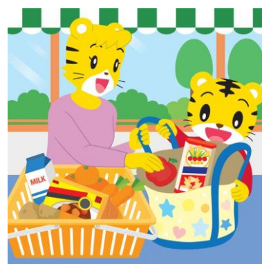
エコシーンまちがいさがし

「エコシーンまちがいさがし」は①冷蔵庫で食材を探すシーン、②買い物をするシーン、③調理シーン、④食事シーンの全4種類。各シーンで、“食品ロス対策”、“エコバッグ利用”、“短時間調理”、“食べきり”などを意識いただけるようになっています。