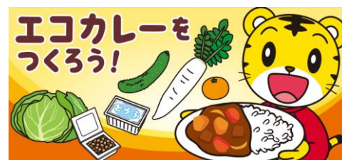
エコカレーをつくろう！ゲーム

そのほかにも、お子さまが簡単にエコを理解できるよう、イラストを活用して解説する記事を順次公開。また、ご家族に対しては、食卓だけでなく、お店など身近な場所でもお子さまと一緒にできるエコに関するチャレンジを紹介していくことで、理解と実践を促していきます。