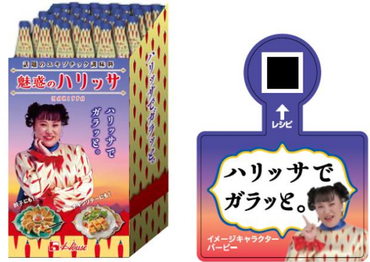
画像 左：ディスプレイ台、右：製品タックシール

また、製品には QR コードを掲載したタックシールを貼りつけし、プロモーションページに誘導します。