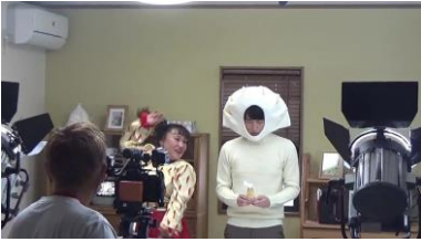
魅惑の踊りで餃子くんを 元気づけるハリッサさん