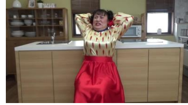
大爆笑必須！！ バービーさんの新ネタ