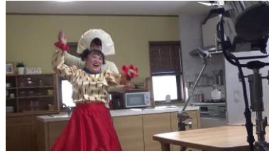
自信を取り戻して踊る ハリッサさんと餃子くん