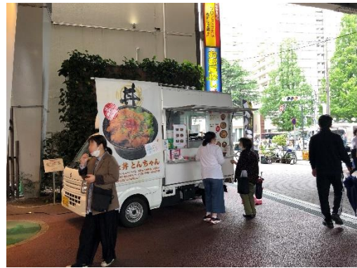
<阿佐ヶ谷駅でのキッチンカー出店の様子>