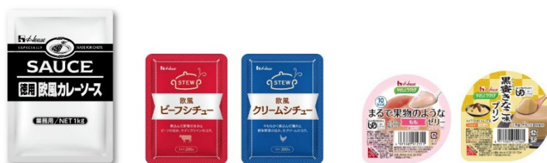
本工場で製造している製品<一例>

特にグループで業務用製品の企画開発・販売を担うハウスギャバン株式会社とのシナジーを発揮させ、外食レストランチェーンから個店までの料飲店や、中食、食品加工業、給食、ケアフード事業など、多様なお客様のニーズに対してスピードとフレキシビリティを兼ね備えた生産体制を実現します。また、ハウス食品グループの研究開発・技術を活用し、家庭用製品の製造も含めて様々な製品展開をおこなってまいります。