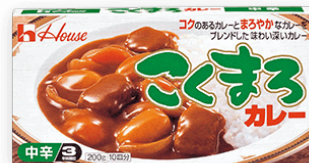
1996 年発売当時のパッケージ

「こくまるカレー」は、調理時に2種類以上のルウを混ぜ合わせているというお客様の調理実態から、「コクのあるカレー」と「まろやかなカレー」の2つをブレンドした「コク深く、まろやかなカレー」として誕生しました。「こくまる」という優しい響きが特徴です。