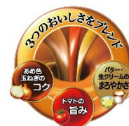
こくまるバターチキンカレーのイラスト

「3つのおいしさをブレンド」していることをより知っていただけるように、「こくまるバターチキンカレー」は、玉ねぎ・トマト・バター・生クリームのイラスト、「こくまるキーマカレー」は、玉ねぎ・プルーン・レーズン・トマト・生クリームのイラストを追加し、味わいをよりわかりやすく伝えられるようにしました。