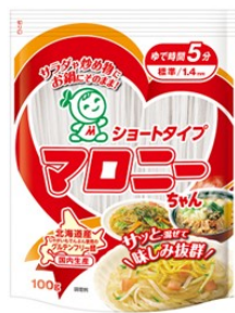
ショートタイプ マロニーちゃん100