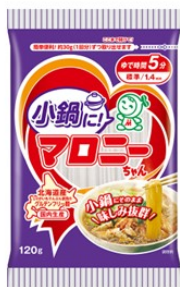
小鍋に！ マロニーちゃん120