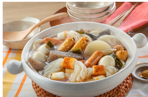
ちくわマロニー入りおでん