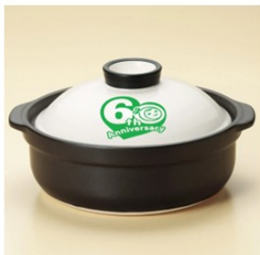
60周年オリジナル マロニーちゃん土鍋