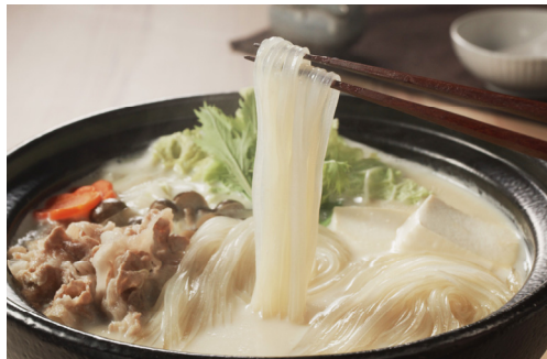
マロニーの豆乳鍋