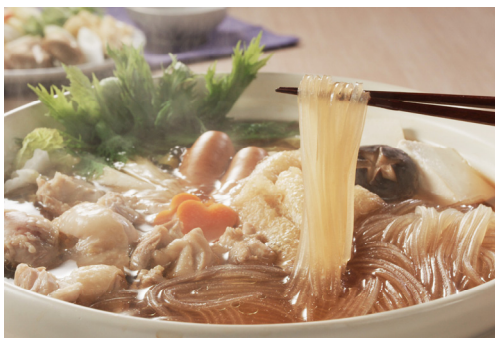
マロニーの寄せ鍋

「マロニーちゃん」ブランドサイト URL : https://housefoods.jp/products/special/malony/index.html