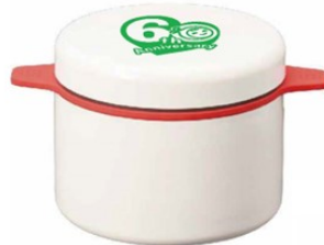
60周年オリジナル マロニーちゃんシリコン鍋