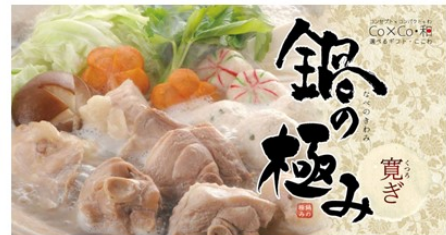
鍋ギフトカタログ （WEB版）