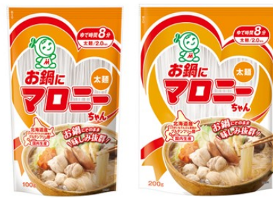
お鍋にマロニーちゃん100/200