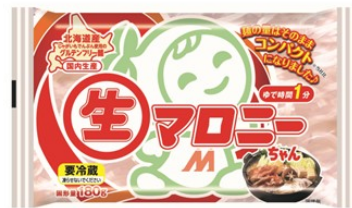
生マロニーちゃん180

※一部店舗で販売している企業専売品（マロニーちゃん300、ショートタイプマロニーちゃん200）も対象となります。