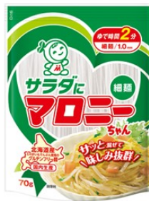
サラダにマロニーちゃん70