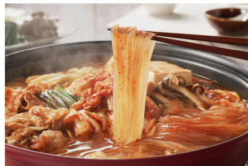
マロニーのキムチ鍋