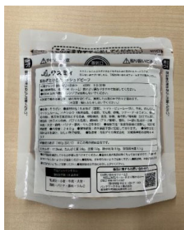
< これまでの商品パッケージ >

より子どもが食べやすいよう具材のカットサイズや味付けを見直すなど味づくりへのこだわりを強化し、メニューや美味しさ伝わりやすく、子どもに親しみやすいデザインに刷新いたします。