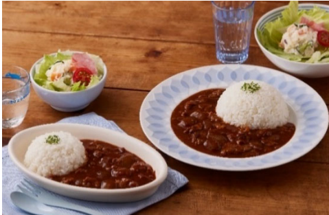
「保育園で人気のハッシュドビーフ」