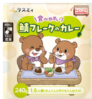
< 新たな商品パッケージ（一例） >