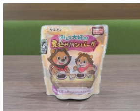
「みんな大好き煮込みハンバーグ」