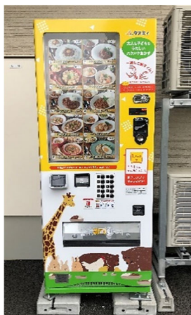
第一弾事業実証：自動販売機