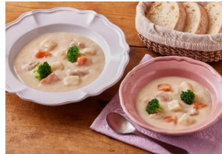
「やさしい味わいのクリームシチュー」