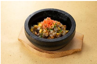
石焼きうまかつちゃんガーリックライス