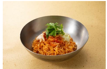
うまかつちゃんびびん麺