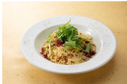
カルボナーラ de うまかつちゃん