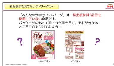
【表示の見方を学ぶワーク】