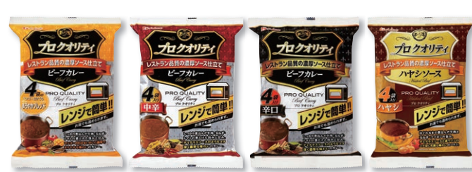
ビーフカレーまるやかブレンド 4袋入り×1セット ビーフカレー中辛 4袋入り×1セット ビーフカレー辛口 4袋入り×1セット ハヤシソース 4袋入り×1セット