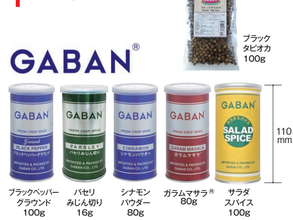
ブラックペッパー グラウンド 100g ハセリ みじん切り 16g シナモン パウダー 80g ガラムマサラ® 80g サラダ スパイス 100g

※本格的に料理を楽しむ方向けのサイズです。 ※組合せ内容は変更になる場合があります。