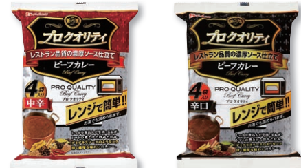
ビーフカレー中辛 4袋入り×1セット ビーフカレー辛口 4袋入り×1セット